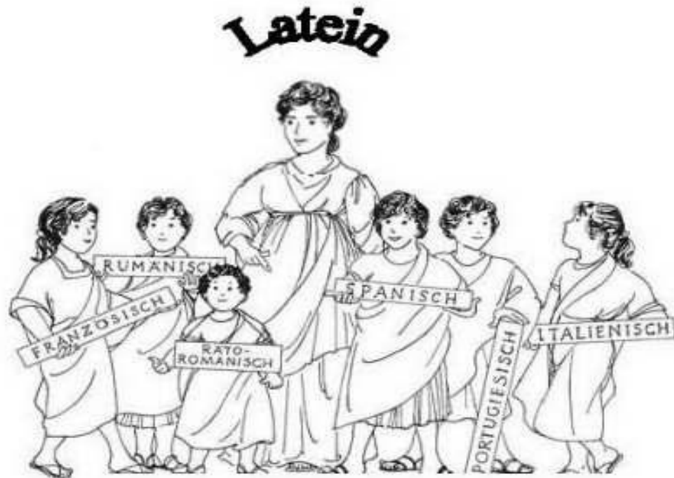
Mutter Latein und ihre Töchter

Latein ist die Basis vieler moderner europäischer Fremdsprachen