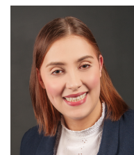
B.Book (D, S),