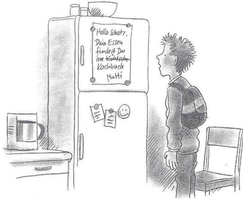
Kompetenzen in Hauswirtschaft haben Schlüsselfunktion